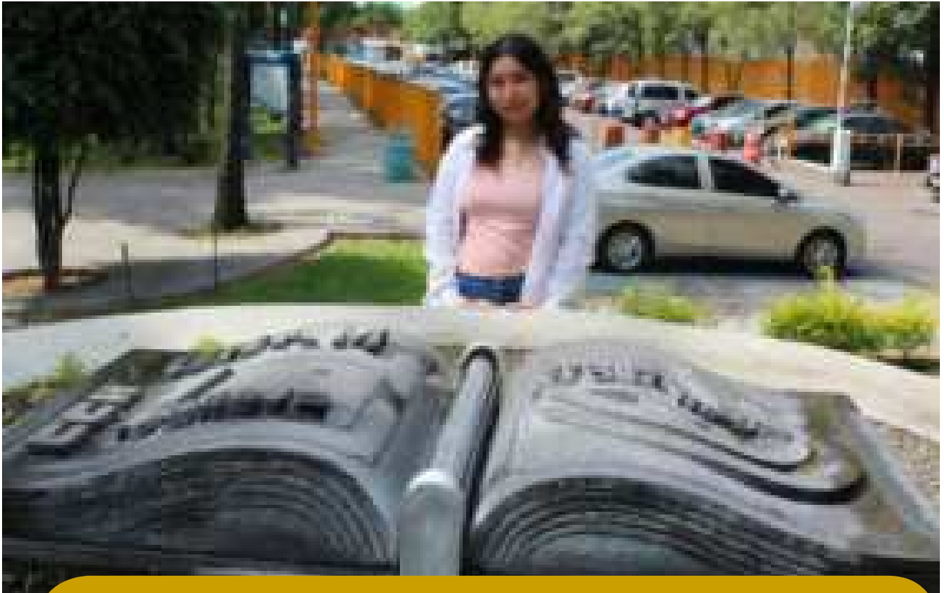
Fotografía: Diana Fernanda Velázquez Ortiz

Alumna de Vallejo, se gradúa con uno de los PROMEDIOS MÁS ALTOS y se prepara para una prometedora carrera en LITERATURA DRAMÁTICA Y TEATRO