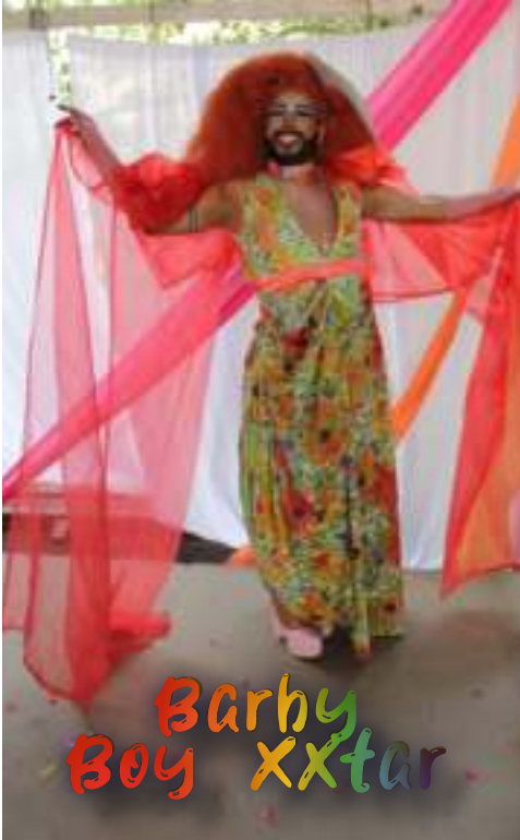
Barhy Boy Xxtar